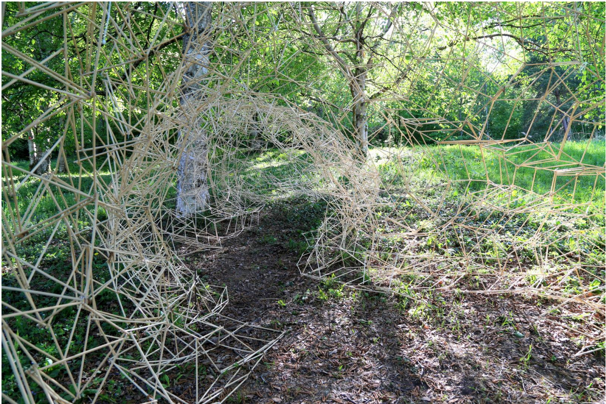
GROTTE-SQUE, Monique Kuffer