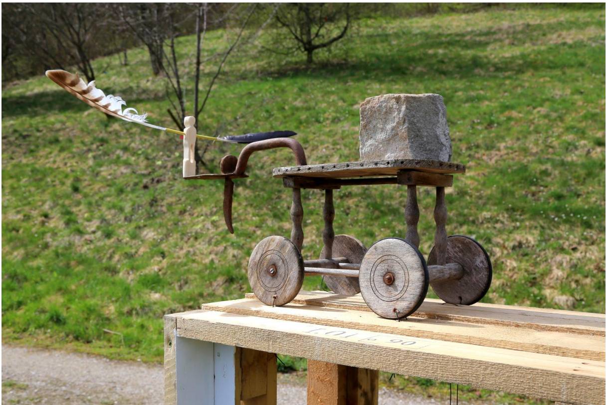
FACE A FACE, ALGAX