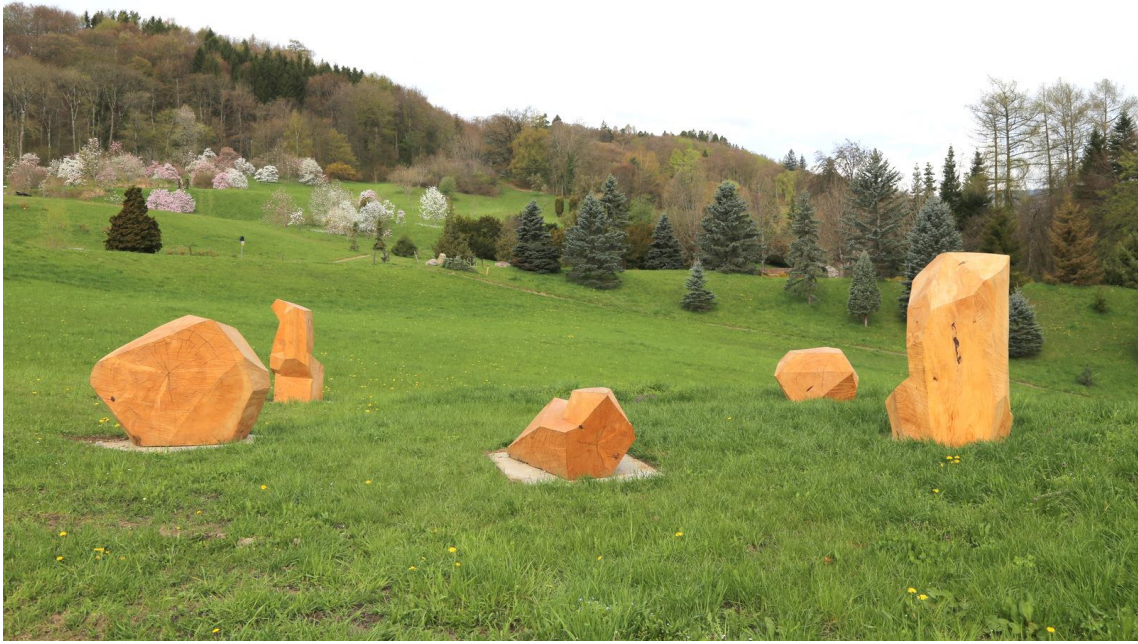
DIAMANTS EN BOIS, Luc Tiercy