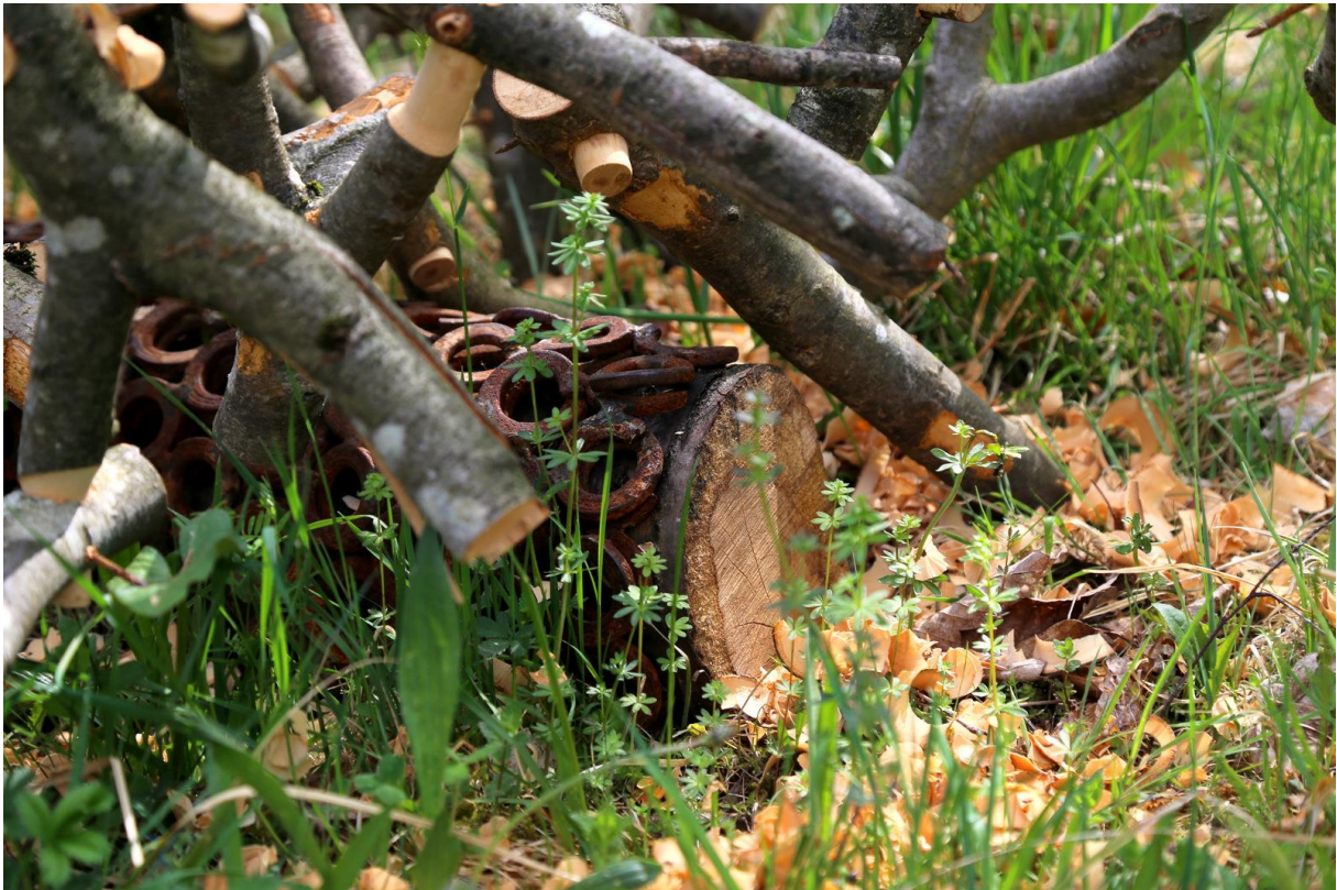
MODESTOCENE, Fabrice Schüsselé & Sébastien Bohner