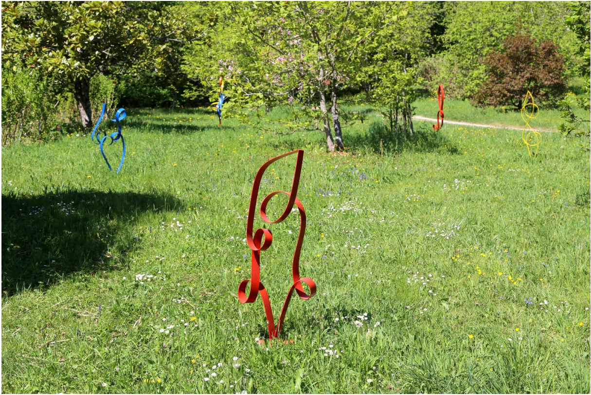
CONTOURS, Bernard Thomas