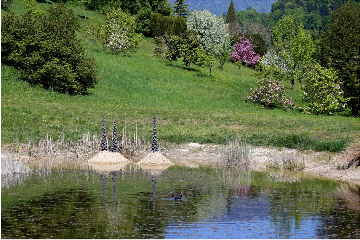
ARBORESCENCES, Christine Demièrre