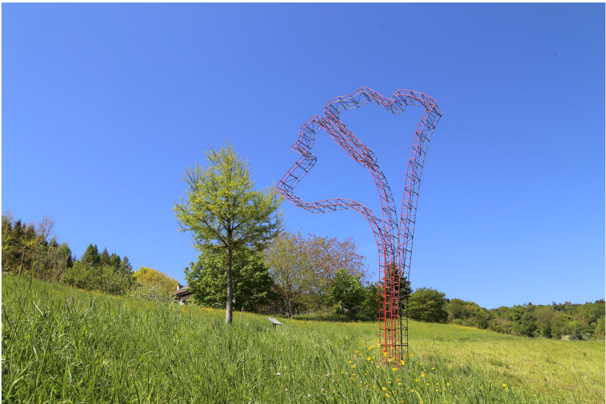
DIALOGUES, Henri Bertrand