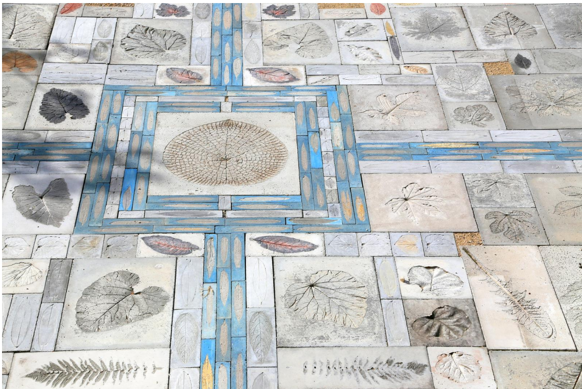
TAPIS JARDIN VII, Christoph Rihs