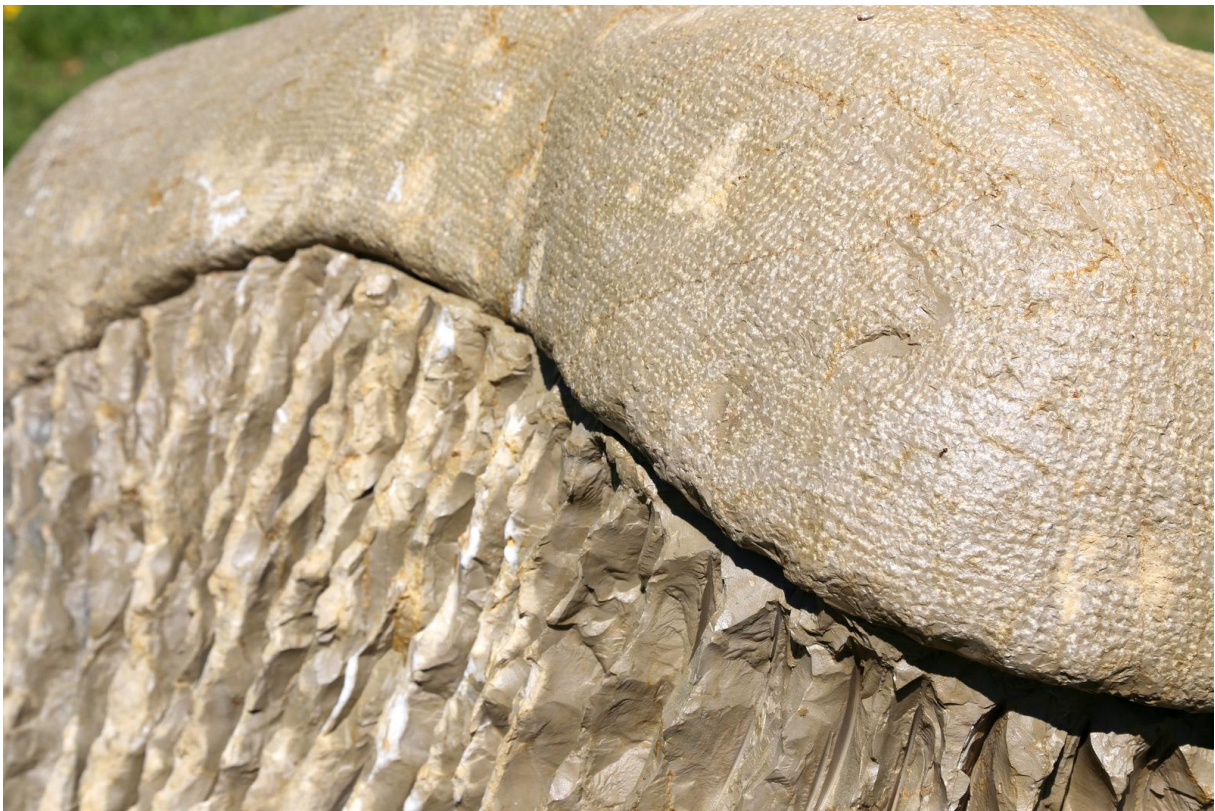
I. LACERTA II. ANGUILLA III. LIMACEA, Pascal Liengme