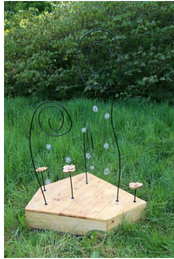
LA TRILOGIE DE DARWIN, Arty'Sculpte