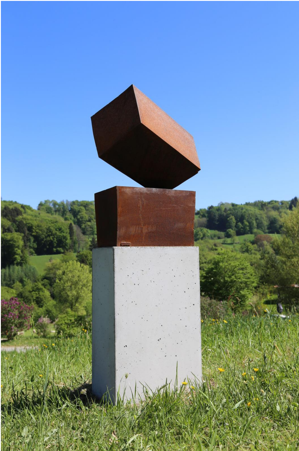
SANS TITRE, Michel Mouthon